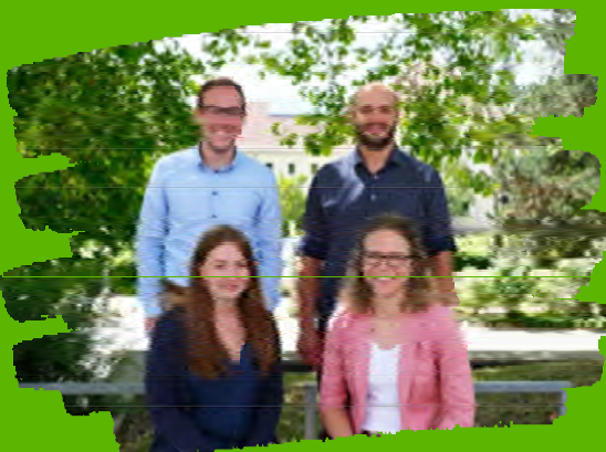
Das HIKE Team